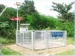
สถานีเตือนภัยด้วย ปริมานน้ำฝนและระดับน้ำ